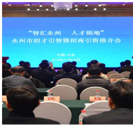
永州市招才引智暨招商引资推介会现场。

此次在京开展的招才引智活动, 永州通过引进人才与引进团队相结合、招才引智与招商引资相结合、市直引才与县区引才相结合、综合组引才与专业组引才相结合、体制内引才与体制外引才相结合等新举措, 积极对接高素质人才链与项目产业链, 更具针对性和精准度, 并打通体制藩篱和身份障碍。